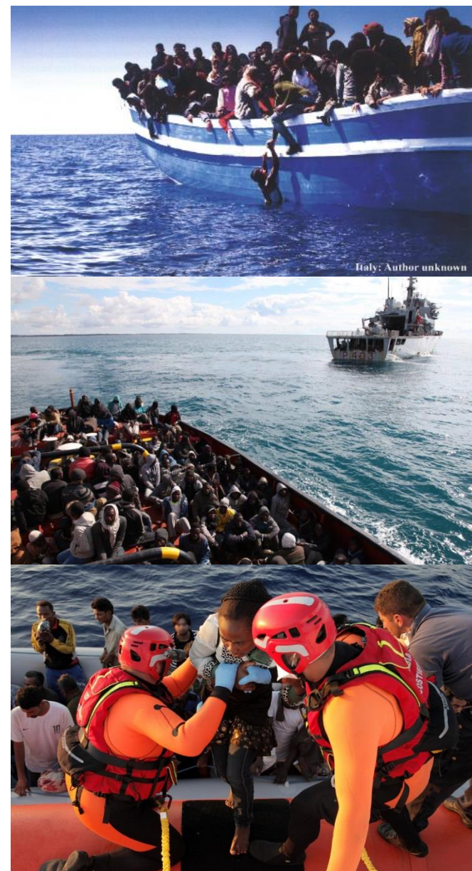
Italy: Author unknown

Renforcement des activités de Frontex → Agenda de la Commission européenne sur la migration (13 mai 2015)