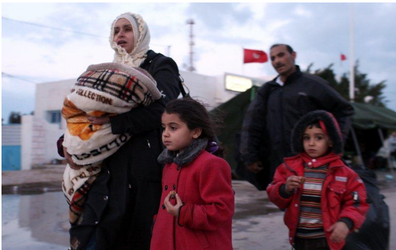
Photo : Réfugiés libyens arrivant en Tunisie, 2011

La réunion porte sur différents aspects des mouvements de population dans la région MTM résultant de situations de crise