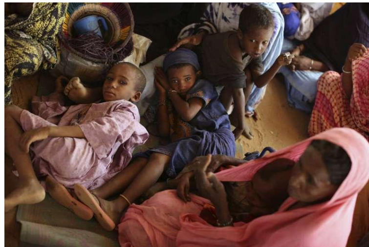
Photo : Réfugiés maliens au camp de réfugiés de Goudebou au Burkina Faso, 2013